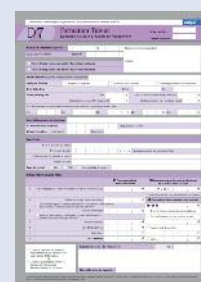
DPC formation tuteur

Imprimés téléchargeables sur le site www.unifaf.fr