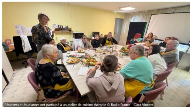
Résidents et étudiantes ont participé à un atelier de cuisine thérapie